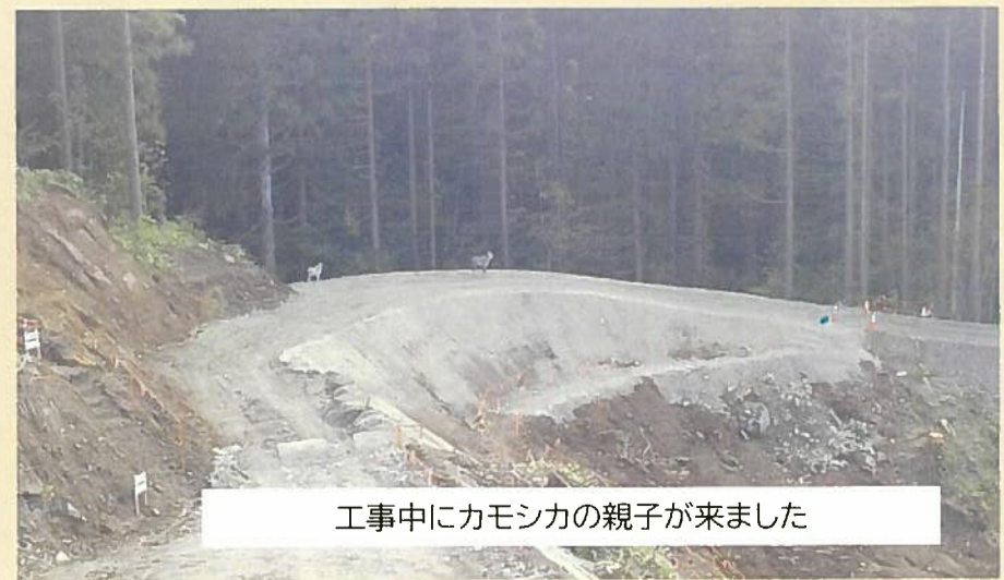
工事中にカモシカの親子が来ました