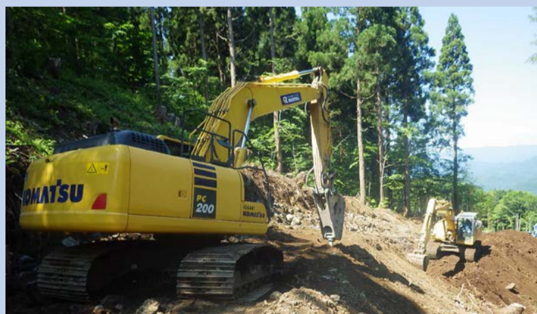
運搬路を作っている様子です。