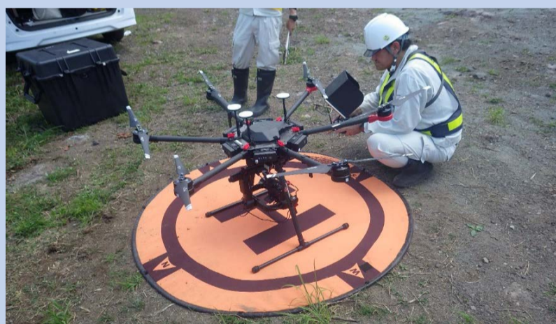
ドローンを使って測量をしました。